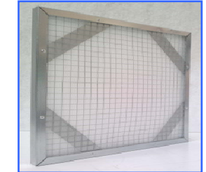
Cara de Salida de aire (en Cód. 4RA)